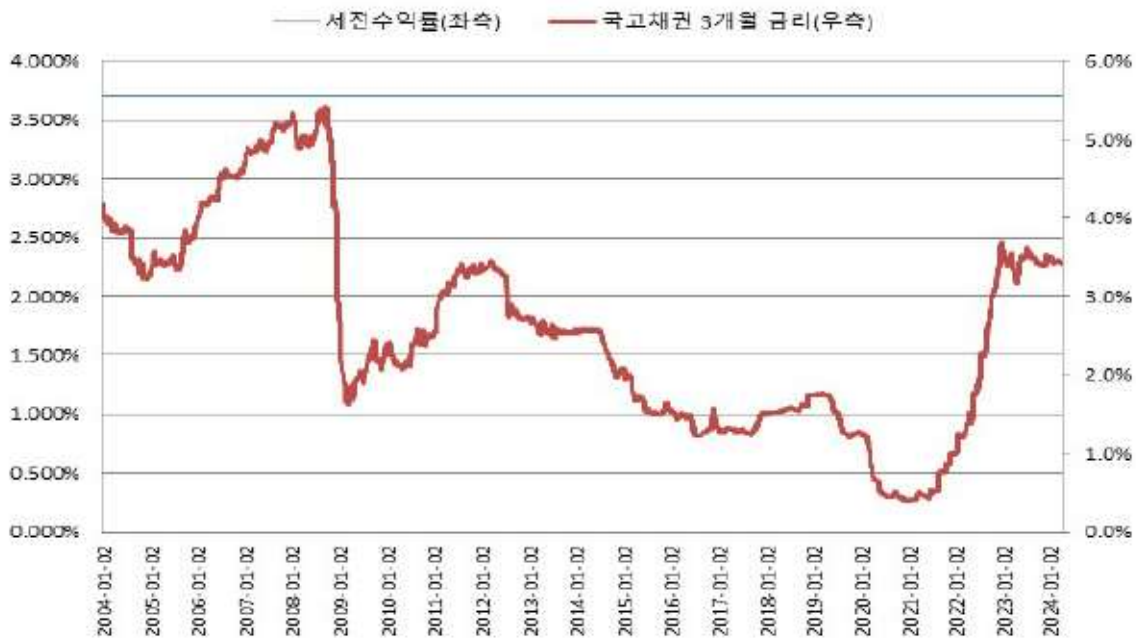
BNK투자증권 제132호 BACKTEST(간투)